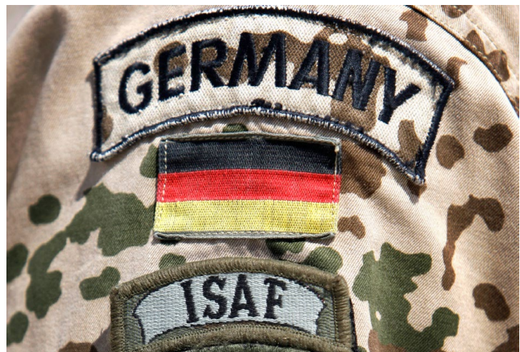
Der verlustreichste und einer der anspruchsvollsten Auslandseinsätze der Bundeswehr unter NATO-Führung: der Afghanistan-Einsatz 2003-2021

Wehrdienst und Wehrpflicht sind mehr als Rekrutierungsinstrumente. Sie berühren das Selbstverständnis einer demokratischen Gesellschaft, die Sicherheit nicht allein staatlichen Institutionen überlässt, sondern auf Mitwirkung baut. Ob in Uniform, im Zivilschutz oder in der individuellen Notfallvorsorge: Engagement stärkt die Handlungsfähigkeit des Gemeinwesens. Die demokratische Einbindung der Streitkräfte, die föderale Struktur des Bevölkerungsschutzes und das breite ehrenamtliche Fundament bilden gemeinsam ein System, das Sicherheit als gesamtgesellschaftliche Aufgabe versteht. 🟢