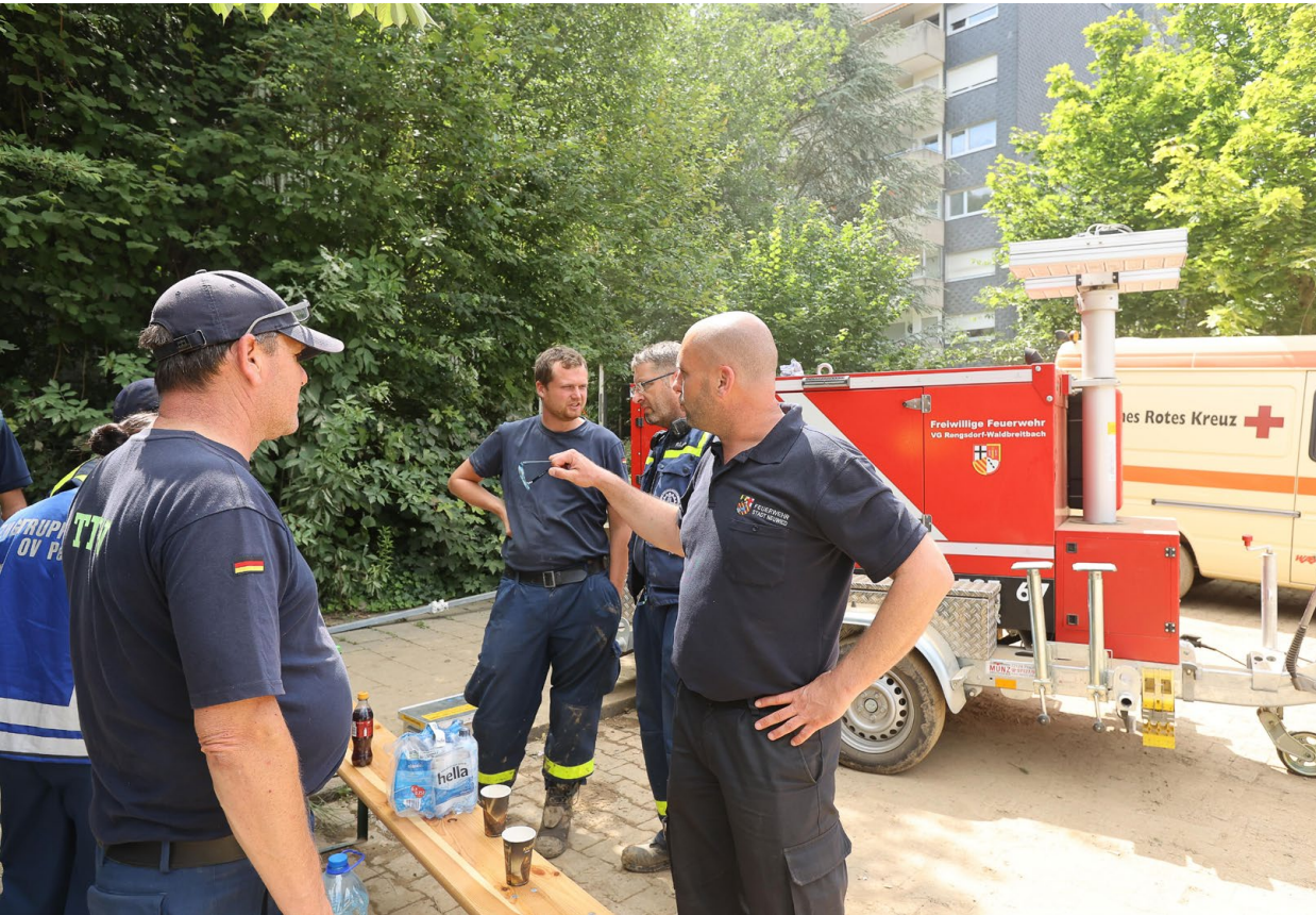
Bei der Bekämpfung der Flutkatastrophe im Ahrtal im Juli 2021 waren sämtliche militärischen und zivilen Organisationen, wie hier THW, Freiwillige Feuerwehr oder Deutsches Rotes Kreuz, eingebunden.