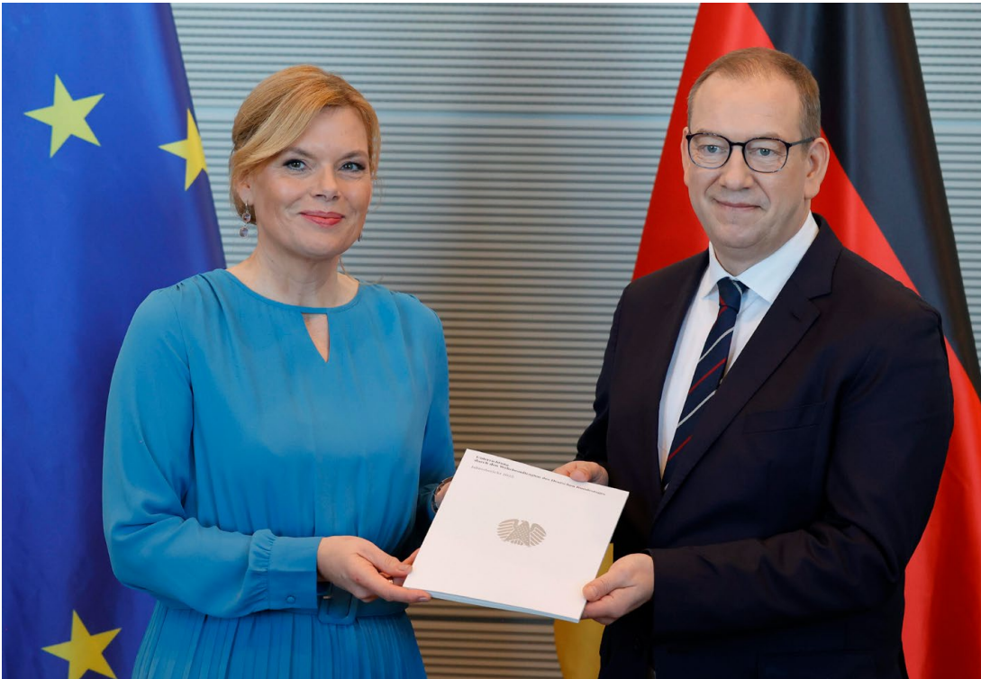
Bundestagspräsidentin Julia Klöckner (li.) nimmt von Henning Otte den Jahresbericht für das Jahr 2025 entgegen, Berlin, 3. März 2026.