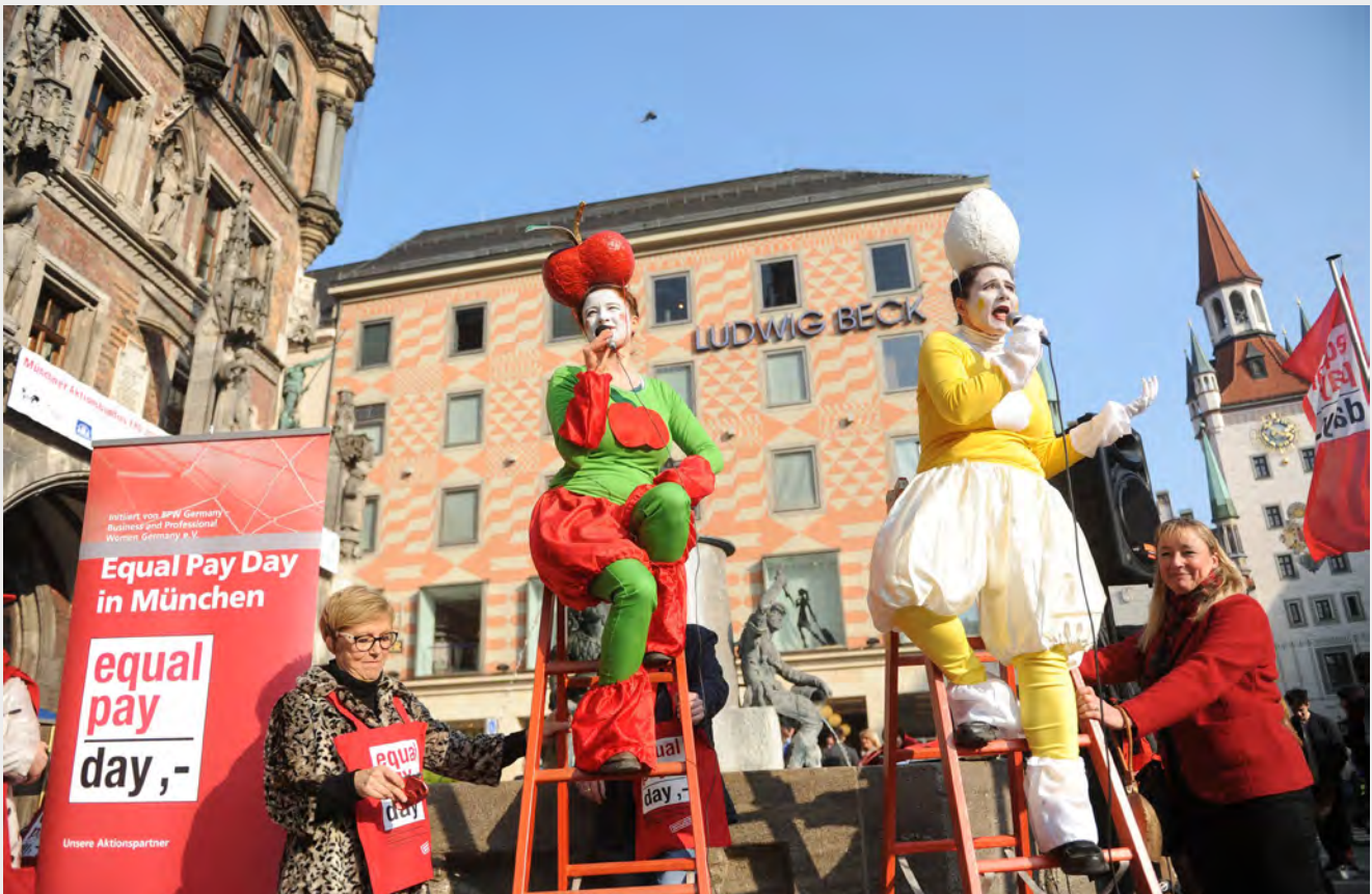
Aktionstag zum „Equal Pay Day“ auf dem Münchner Marienplatz 2016 für die gleichberechtigte Bezahlung von Mann und Frau. Im Bild erklimmen „Frau Apfel und Herr Ei“ die symbolische Karriereleiter.

sive Anfeindungen, die zumeist auch eine Sexualisierung beinhalten und der Einschüchterung dienen sollen. 15 Hiervon sind besonders junge Frauen in der Politik und nochmals häufiger junge Migrantinnen betroffen. Jüngstes Beispiel ist die neue Sprecherin der Grünen Jugend Sarah-Lee Heinrich. 16