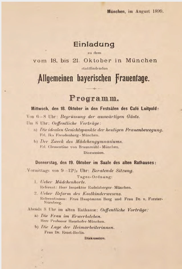
Einladung zum „Allgemeinen bayerischen Frauentage“ 1899

ber 1899 im Café Luitpold und im Alten Rathaussaal stattfand und an dem Frauen und Männer aus 50 bayerischen Städten teilnahmen. 5 Zentrale Forderungen waren rechtliche Gleichstellung und der Zugang zu Bildung und Erwerbsarbeit für Frauen. Nachhaltige Impulse der Frauenbewegung in Bayern konnten sich gleichwohl nicht durchsetzen.