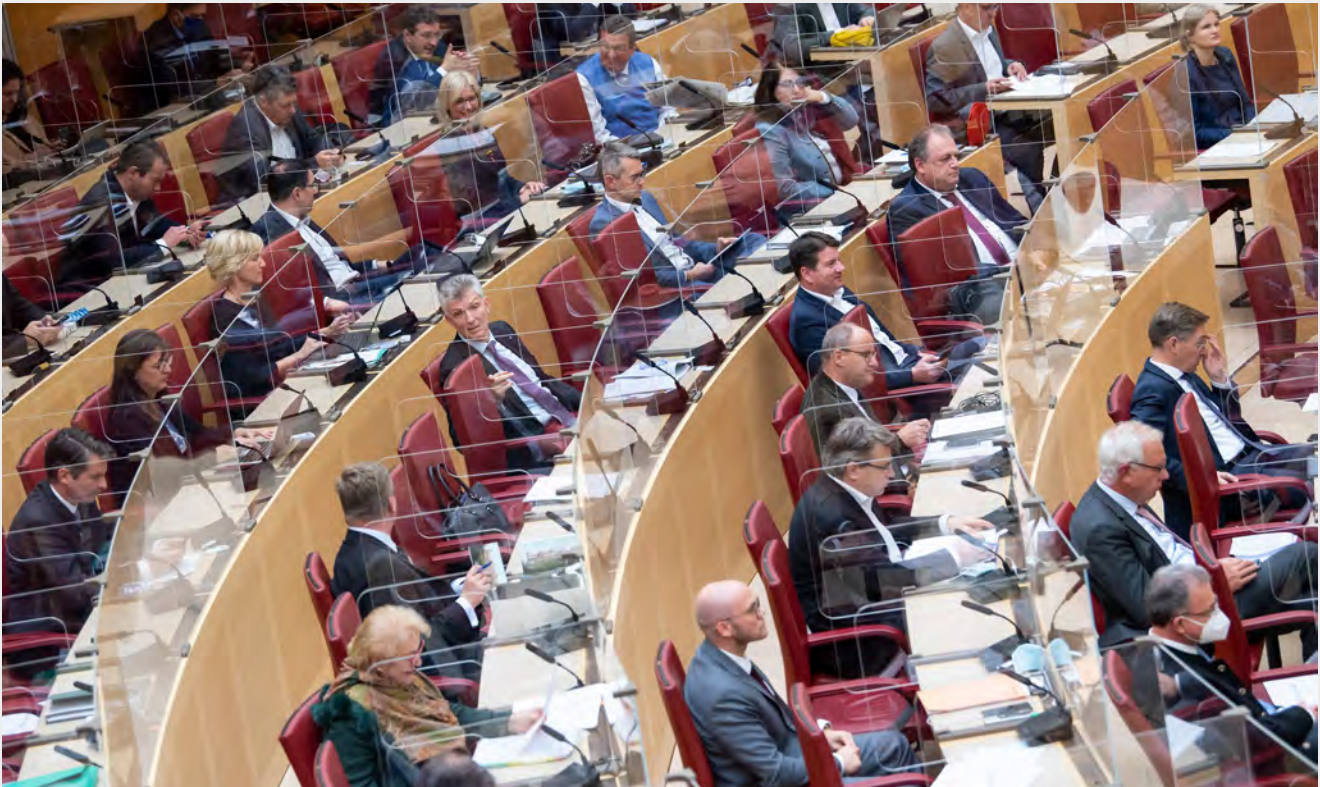
Die Abgeordneten des bayerischen Landtags in einer Plenardebatte, Oktober 2020.

hoher Zahl wie Männer politische Ämter und Mandate innehätten, könnten sich Umgangsformen, Annahmen über Politik und politikrelevante Themenspektren ändern.