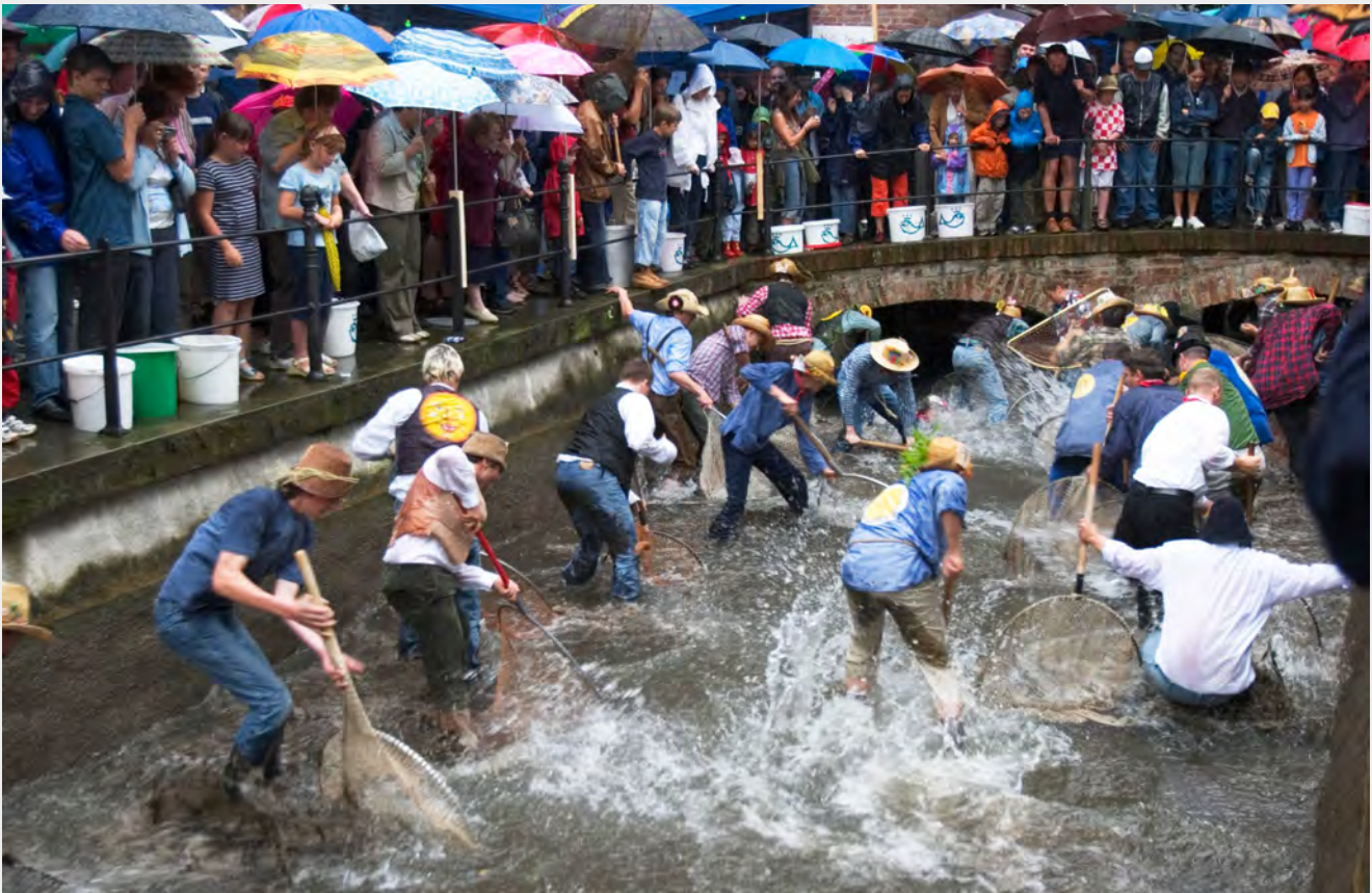
Fischertag in Memmingen. Erst mit einem Urteil vom Juli diesen Jahres ist es auch Frauen erlaubt, am Traditionstag des Fischereivereins nach Forellen zu fischen.