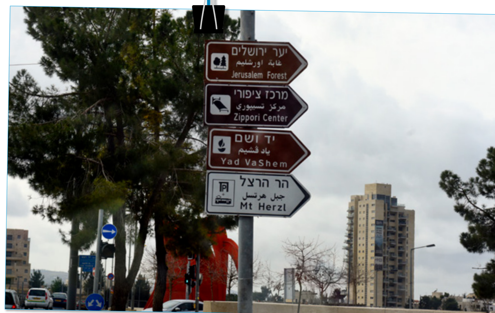
Israelische Straßenschilder in hebräischer, arabischer und englischer Sprache: Yad VaShem ist der Name der bedeutendsten Holocaust-Gedenkstätte in Israel. Ganz in der Nähe liegt der Mount Herzl , auf dem der Begründer des politischen Zionismus, Theodor Herzl, und bedeutende israelische Staatsmänner und -frauen begraben liegen.

Die Quellenangaben für die Abbildungen auf diesem Plakat finden sich im Beiheft S. 39 ff.