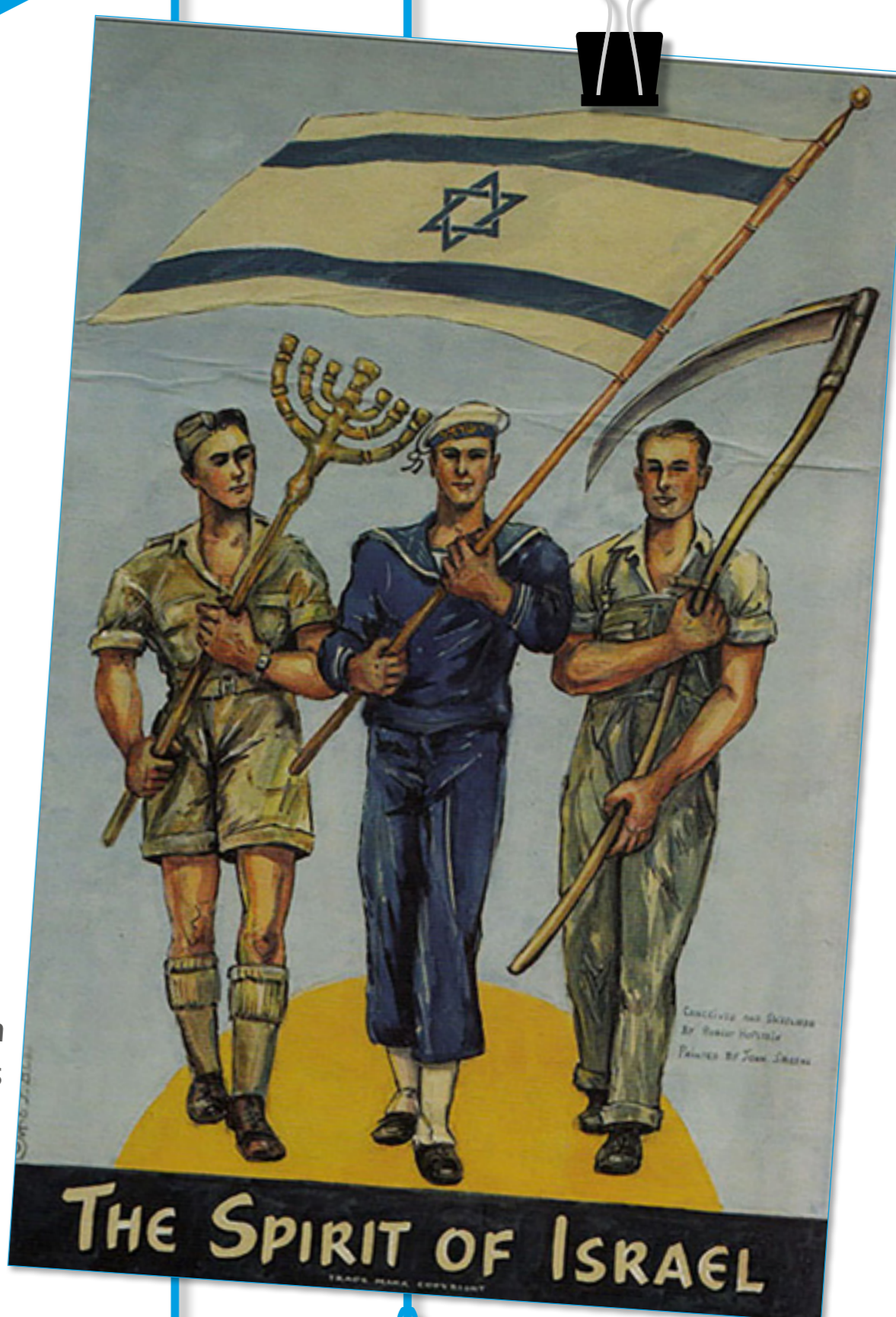
Dieses Poster aus den Anfangsjahren des Staates Israel zeigt das Idealbild des „neuen Juden“ und nationale Symbole des Staates Israel.

Eine ständige Verwandlung – trifft diese Beschreibung auf die israelische Gesellschaft zu? Scanne diesen QR-Code, wähle den Hörbeitrag mit dem Titel dieses Plakats aus und erfahre mehr über die israelische Gesellschaft.