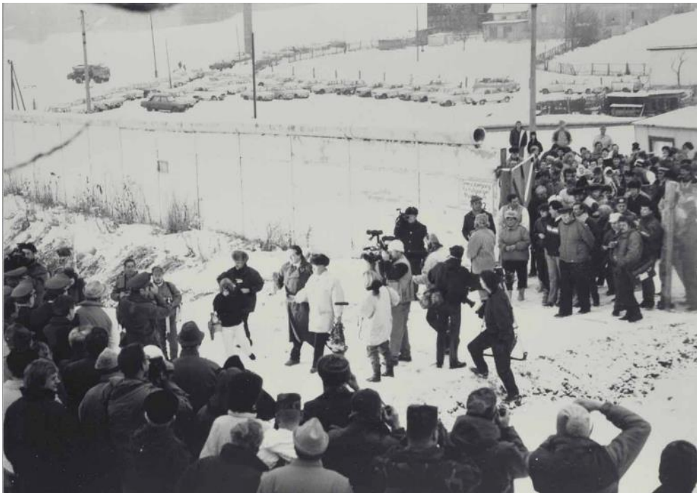
Mödlareuth, 09.12.1989; Deutsch-Deutsches Museum Mödlareuth

Interpretiere die Bilder aus Mödlareuth aus dem Jahr 1989!