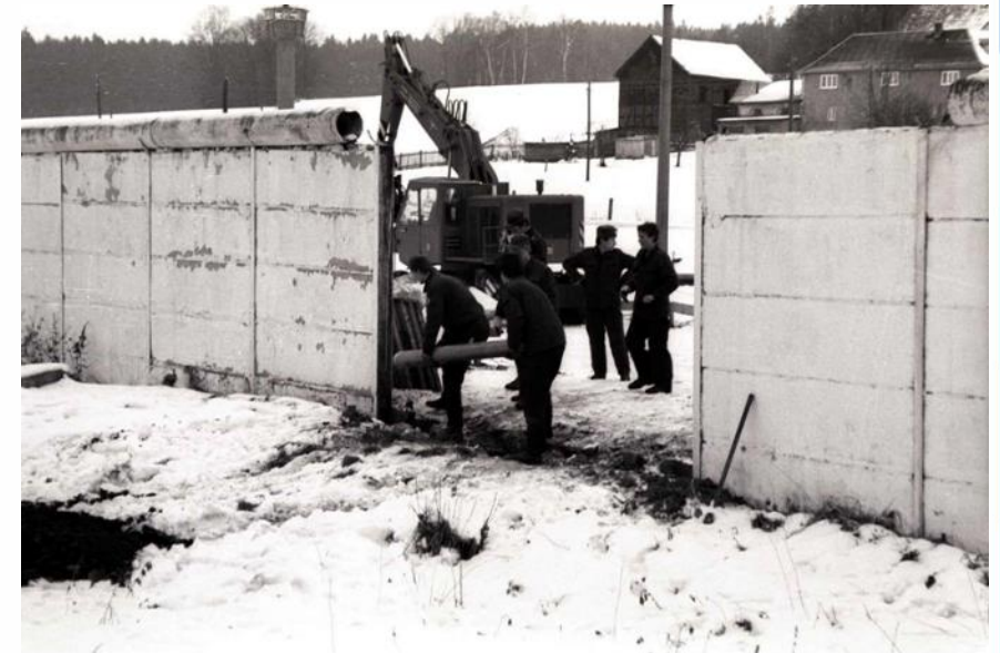
Mödlareuth, 07.12.1989; Deutsch-Deutsches Museum Mödlareuth