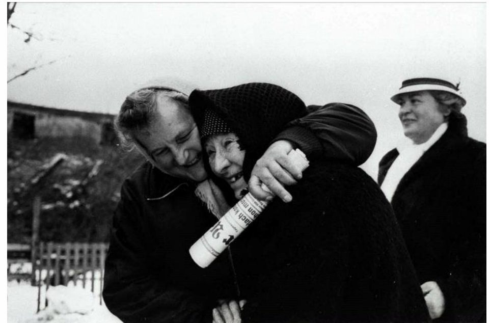
Mödlareuth, 07.12.1989; Deutsch-Deutsches Museum Mödlareuth