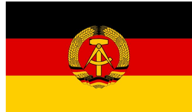
Flagge der DDR