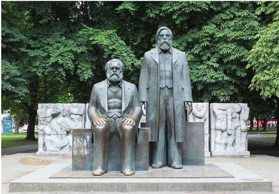
Statue von Marx und Engels in Berlin – Marx und Engels veröffentlichten 1848 gemeinsam „Das kommunistische Manifest“.