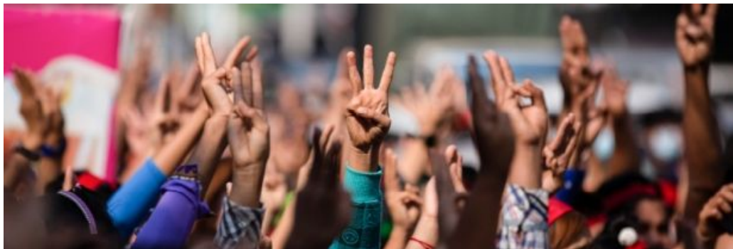
Drei Finger in die Höhe gereckt als Protest gegen die Militärs in Myanmar, Februar 2021