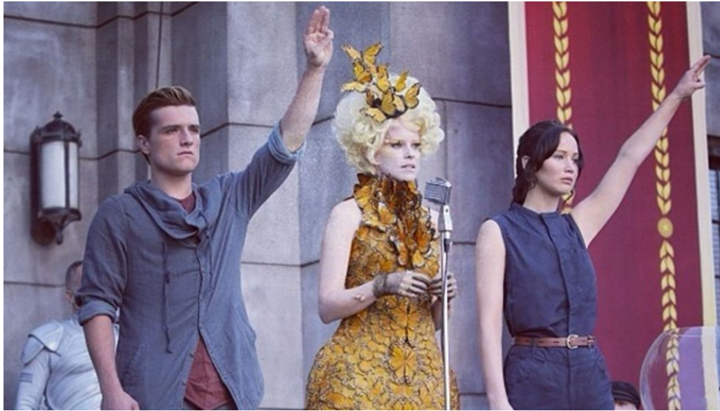
Filmszene aus „Die Tribute von Panem 2 – Catching Fire“.